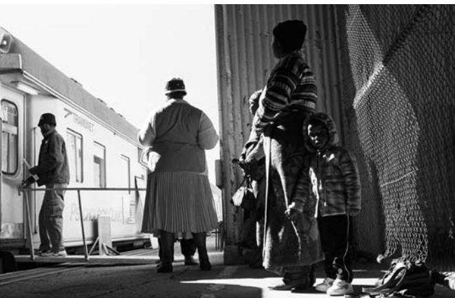
Tren médico Phelophepa (2000)

Patrocinadores: AECID, Teatro Juan Bravo; Diputación de Segovia, Hay Festival.