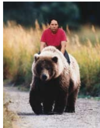
Bear Riding Fotografía Zoe Strauss

Patrocinadores: Caja Segovia, Universidad Europea de Madrid, SECC, Hay Festival, Cromotex, TF Artes Graficas, OMB Design.