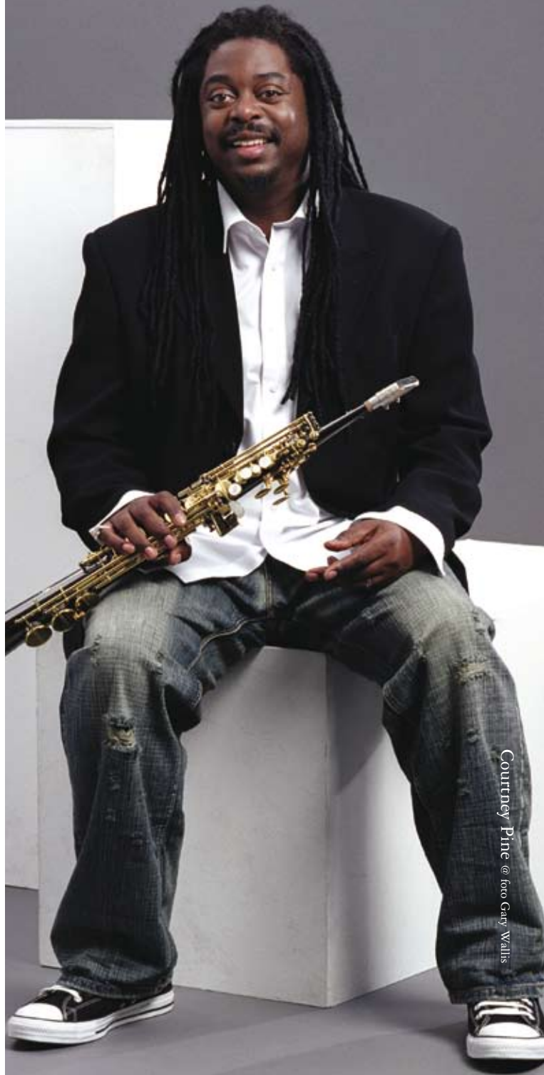
Courtney Pine